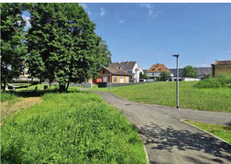
Bereich Brend – Saalemündung

Mit Fertigstellung des BA 04 (letzter realisierter Bauabschnitt) ist die Stadt Bad Neustadt a.d. Saale künftig vor 100 jährlichen Hochwasserereignissen am Wildbach Brend und der Fränkischen Saale geschützt. Dabei wurden nicht nur technische Bauwerke erstellt, sondern auch Geh- und Radwege sowie Räume und Plätze im Bereich des Gewässers mit hoher Aufenthaltsqualität geschaffen, die mit u.a. mit verschiedenen Sitzgelegenheiten zum Verweilen einladen.