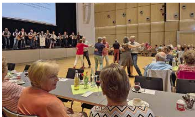
Gemeinsames Singen mit Promiband