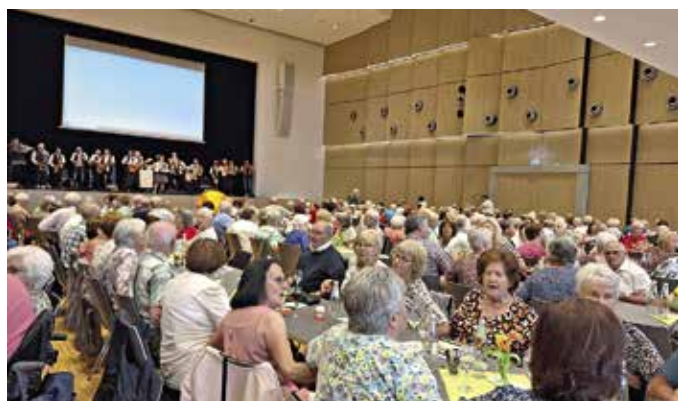
Gemeinsames Singen beim Musikalischen Seniorennachmittag der NS-Allianz

Im Wechsel mit der auch ohne elektrische Verstärkung raumfüllenden Musik der Promiband wurden weitere unterhaltende Programmpunkte vorgetragen. Wer aus den einzelnen Allianz-Gemeinden gekommen war, wollte Gabi Gröschel anhand der Dorfspitznamen herausfinden. Es waren Senioren aus vielen Ortschaften vertreten. So z.B. die Mürschter Nächelsieder, die Ünschlawer Heckescheißer, die Warchetshäuser Dückdelück, die Schönäer Krautklösser, die Haröther Karausche. Die meisten Gäste wussten gleich, wer gemeint war. Jedenfalls