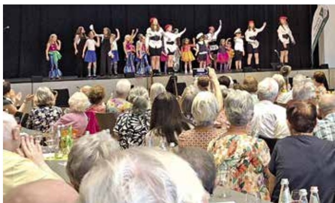
Auftritt der Tanzkids vom SV Herschfeld beim Musikalischen Seniorennachmittag der NES-Allianz