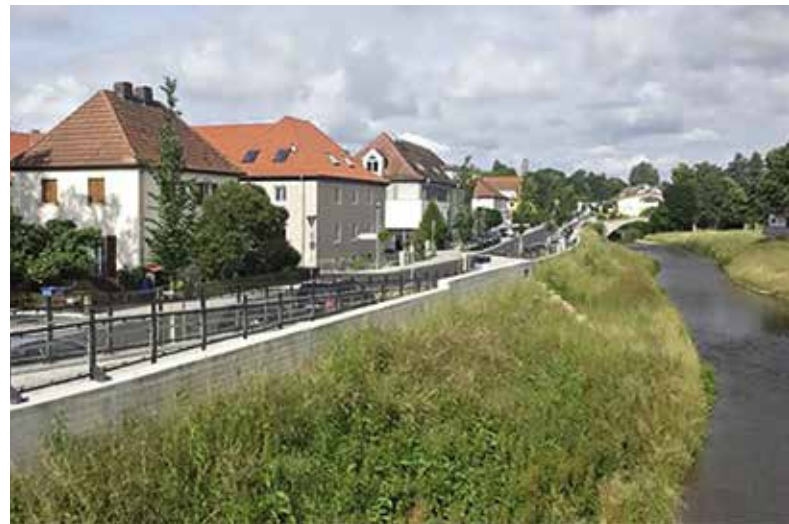
Fotos vor und nach Fertigstellung Hochwasser vor Fertigstellung des Hochwasserschutzes – Bereich Otto-Hahn-Straße.

Brücke“ bis zur Leutershauser Straße beinhaltet, wurde 1985 fertig gestellt. Danach ruhte die Maßnahme. Nach den Hochwasserereignissen in den Jahren 1999 und vor allem 2003 wurden die Planungen wieder aufgenommen. Bereits im Jahr 2006 konnte dann im Zusammenhang mit der Baumaßnahme des Landkreises Rhön-Grabfeld am Rhön-Gymnasium ein weiterer Bauabschnitt zum Hochwasserschutz umgesetzt werden.