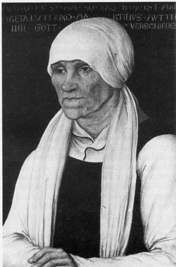
Martin Luthers Mutter